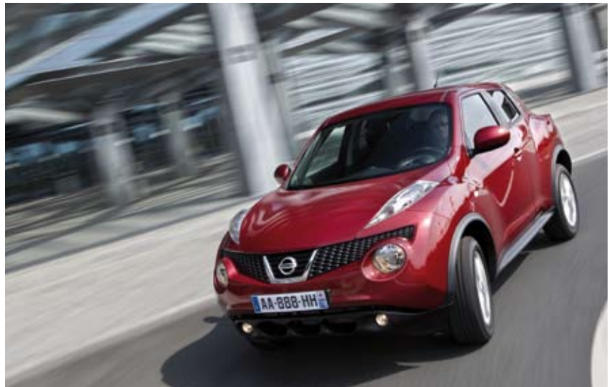
Der Juke verströmt das positive, energiegeladene und hoffnungsfrohe Lebensgefühl eines Beach Buggys der 1960er Jahre.

macht der wendige Juke dank hoher Sitzposition, guter Übersicht und temperamentvollem Motor Spass. Der 1,6-Liter-Turbobenziner mit 190 PS und 240 Nm hat keine Mühe, den bloss 1325 Kilo schweren Fronttriebler flott voran zu treiben. Übrigens: Wer den Juke mit 4x4-Antrieb ordern