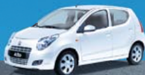
New Alto bereits für Fr. 12 990.- (1.0 GA)