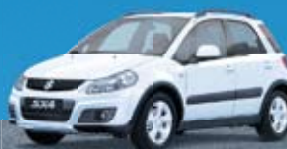
New SX4 bereits für Fr. 21 490.- (1.6 GL Streetline)

NEW SPLASH GL BARRY EDITION AB Fr. 17 990.- auch als Automat, + Fr. 1 500.- + Fr. 30.- für BARRY-Edition-Paket Ihr Vorteil: Fr. 3 420.-