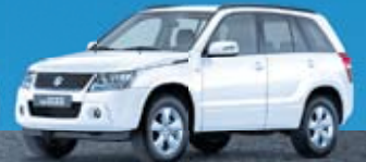
New Grand Vitara bereits für Fr. 29 990.- (1.6 GL Top 4x4, 3-türig)

NEW SX4 GL TOP 4x4 BARRY EDITION AB Fr. 28 990.- auch als Automat, + Fr. 1 500.- + Fr. 30.- für BARRY-Edition-Paket Ihr Vorteil: Fr. 3 920.-