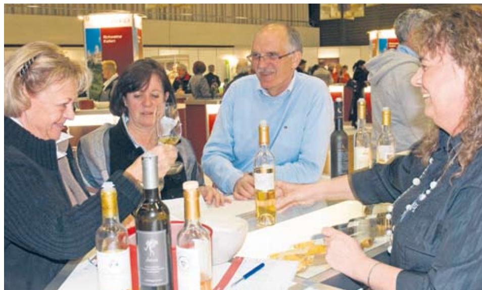
Die Weinfachleute von Coop beraten, informieren und lassen die Besucherinnen und Besucher degustieren.

20% Messerabatt auf alle 336 Weine im Angebot. Bestellte Weine werden von der Post für 10 Franken nach Hause geliefert, bei Bestellungen ab Fr. 500.- ist die Lieferung gratis.