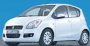
New Splash bereits für Fr. 14 990.- (1.0 GA)

NEW ALTO GL BARRY EDITION AB Fr. 14 990.- auch als Automat, + Fr. 1 500.- + Fr. 30.- für BARRY-Edition-Paket Ihr Vorteil: Fr. 3 420.-